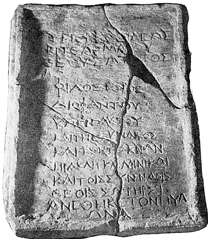
La dédicace à Herakles Kallinikos.