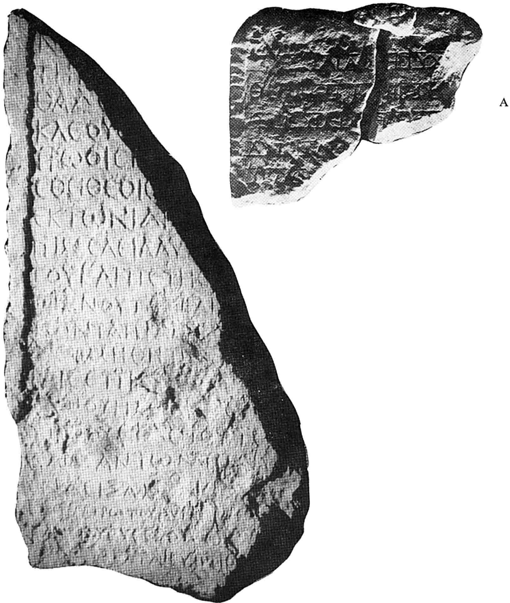
Inscriptions de Dakhleh : A. — Dédicace au dieu Tithoes. B. — Fragment d'une inscription commémorative.