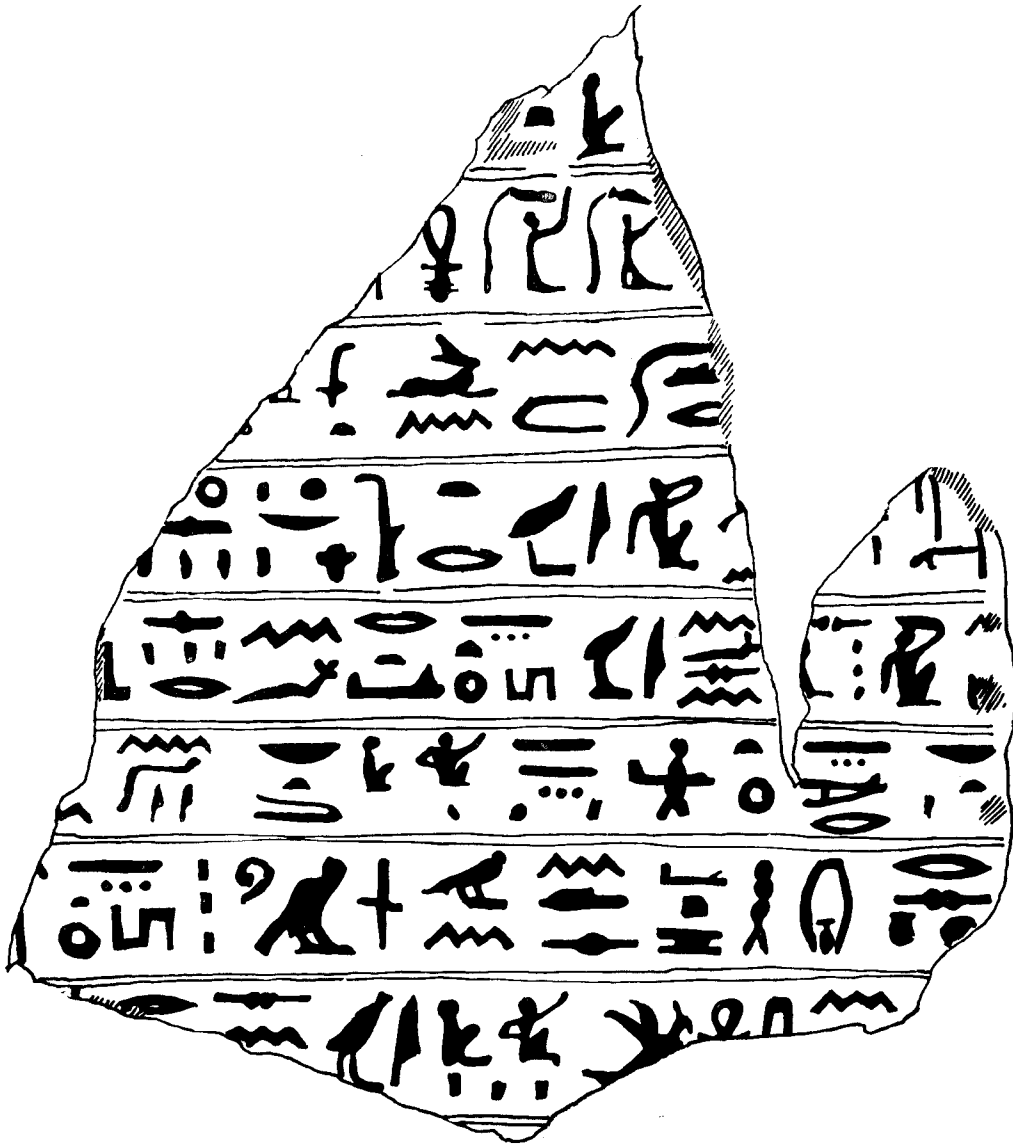
Stèle de Boubastis (échelle \frac{1}{2} ).

Dans cet ordre d'idées, il ne semble pas que le fragment de Port-Saïd/Boubastis doive nous réserver de riches révélations. On peut du moins tirer de son étude quelques remarques sur sa disposition matérielle et sur ses variantes graphiques.