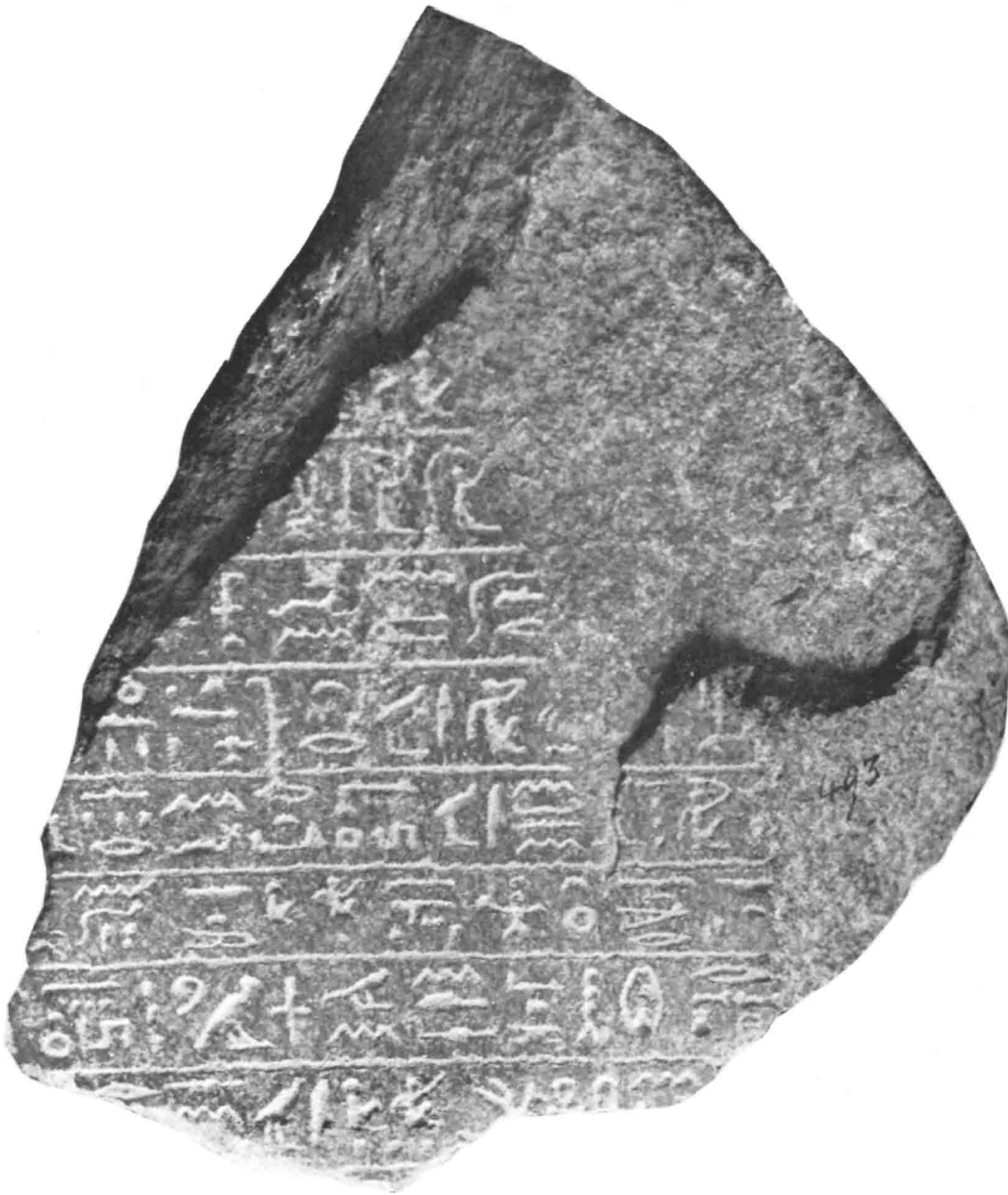
Stèle de Boubastis (= Décr. Canope 2-9).