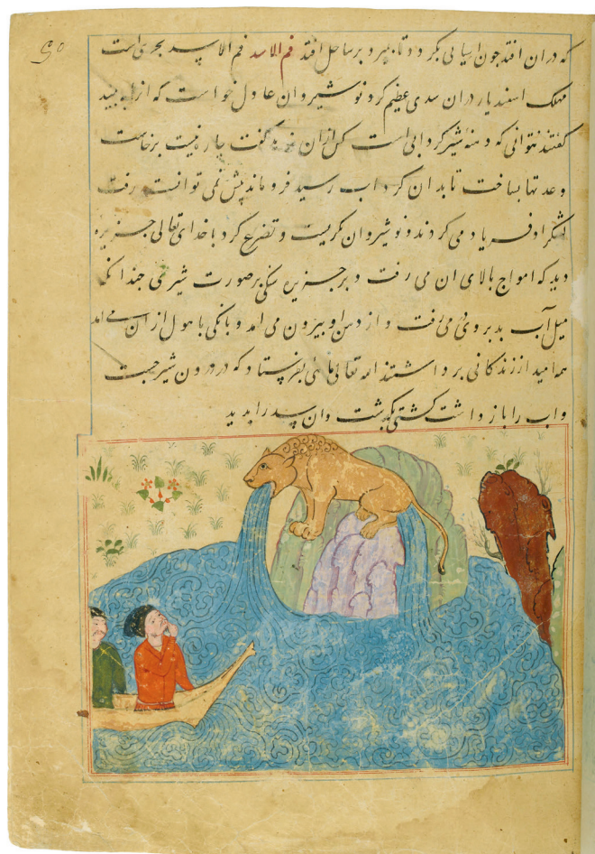
Pl. 1. La source en forme de lion dans la cosmographie d'al-Ṭūsī Salmānī, BnF, Sup. persan 332, f° 50r°.

villageois, la bouche de l'un des lions est brisée ; l'eau cesse de couler d'une des deux bouches et un des deux villages tombe en ruines ; mais la source restante ne bénéficie pas d'un afflux d'eau supplémentaire 78 .