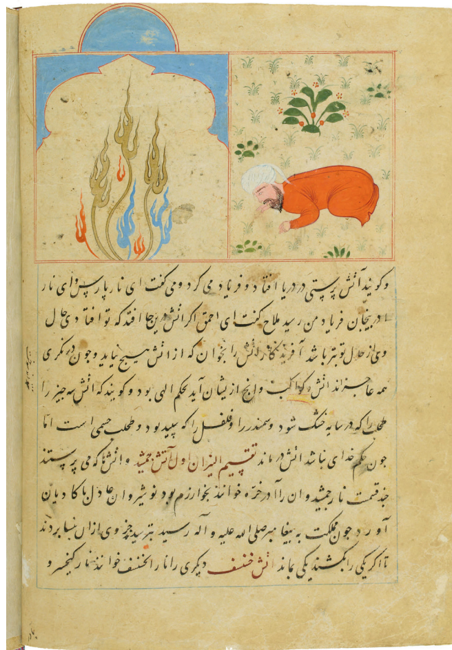
Pl. 3. Un zoroastrien adorateur du feu dans la cosmographie d'al-Ṭūsī Salmānī, BnF, Sup. persan 332, f° 30r°.

C'est le roi Ġamšīd qui fut, d'après les légendes, l'instigateur des temples du feu 160 . Des mages adorant le feu et des temples du feu sont représentés afin d'évoquer non pas le zoroastrisme, mais les différents types de feu auxquels sont asservis les sectateurs (pl. 3) 161 .